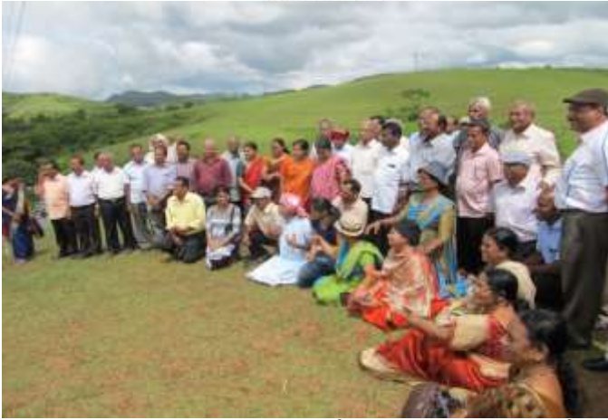
ഫയൽ ഫോട്ടോ:വാഗമൺ വിനോദയാത്രാ വേളയിൽ എടുത്ത ചിത്രം.