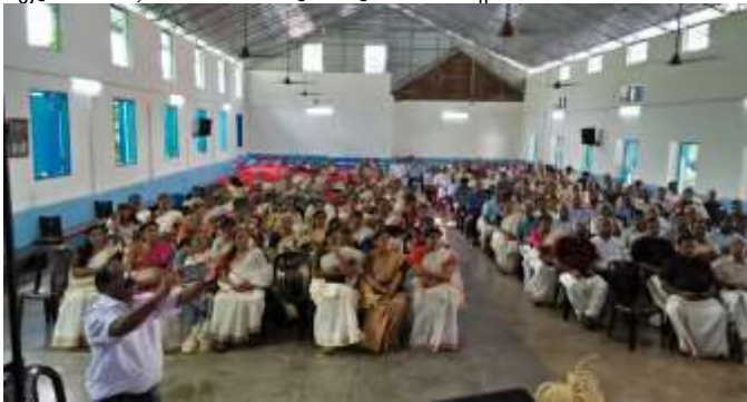
നിറഞ്ഞ സദസ്സിന്റെ ഒരു ദൃശ്യം