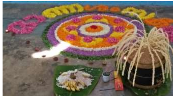
നിറപറയും നില വിളക്കും പൂക്കളവും

നെയ്യണച്ചൊരു ഗുരു വളർത്തിയ കിളി മകൾ പാടി... ദേവ ദൈത്യ മനുഷ്യ വർഗ്ഗ മഹാ ചരിത്രങ്ങൾ... തേൻ കിനിയും വാക്കിലോതി വളർന്നു മലയാളം... (എത്ര സുന്ദരം, എത്ര സുന്ദരം..)